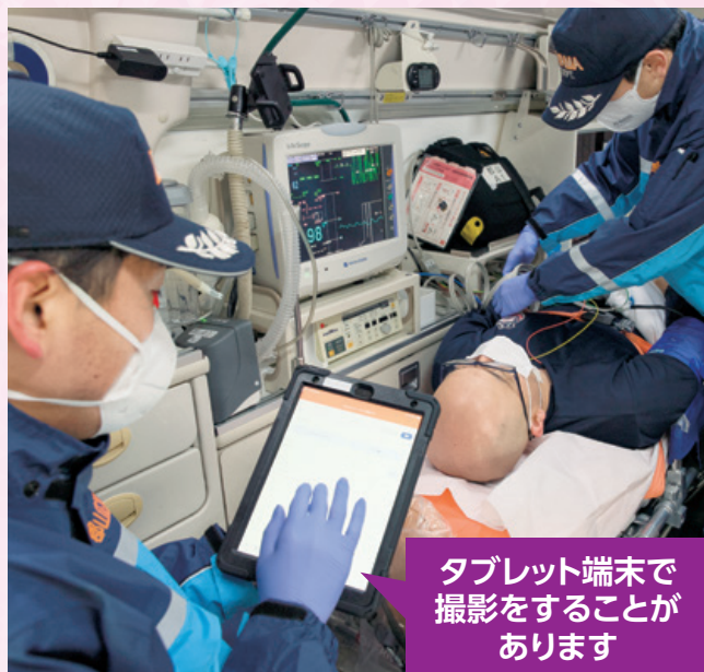
タブレット端末で撮影をすることがあります

事故や傷病者の状況をタブレット端末やスマートフォンで撮影することがあります。撮影した画像は病院との情報共有を目的に使用されます。現場活動へのご理解とご協力をお願いします。