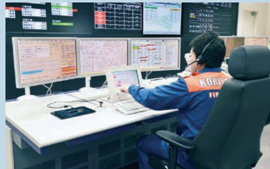
消防指令センター

119番通報があれば、いつでも、どこからでも、火事や救急などの現場に出動します。