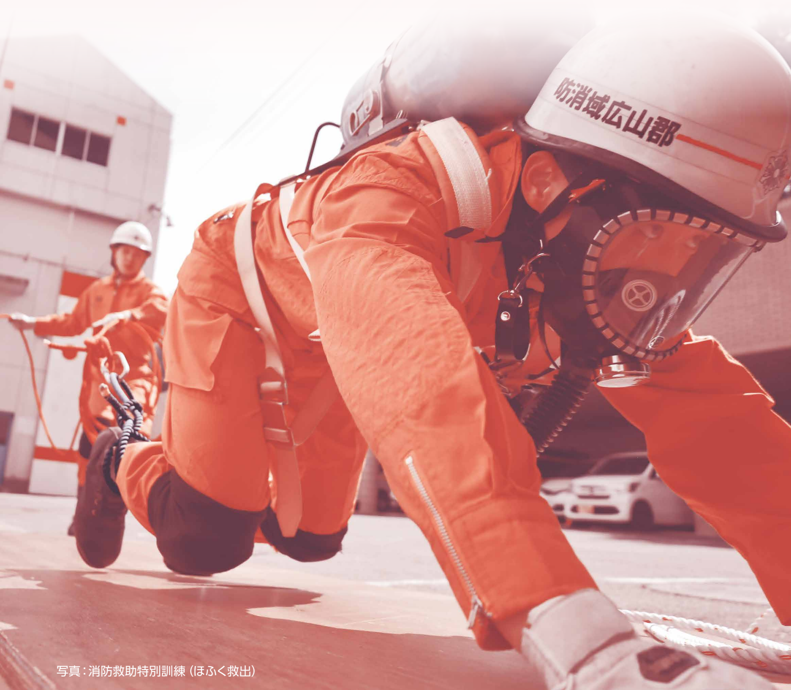
写真：消防救助特別訓練（ほふく救出）