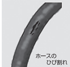
ホースの ひび割れ