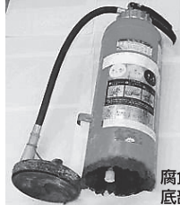
腐食により 底部が抜けた